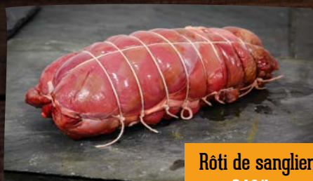
Rôti de sanglier 24€/kg