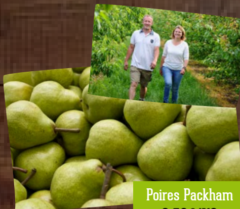
Fruits Bernhard Sigolsheim